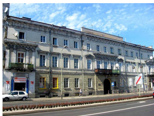
Dom M. K. w Kaliszu

W 1849r. kiedy Maria miała siedem lat zamieszkała w Kaliszu przy dzisiejszym pl. J. Kilińskiego 4, w mieszkaniu na parterze w pałacu Puchalskich.