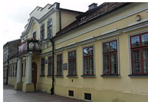
Dom M. K. w Suwałkach

Do siedmiu lat mieszkała wraz z rodzicami w Suwałkach przy dzisiejszej ul. Kościuszki 31 (wówczas Petersburskiej 200).