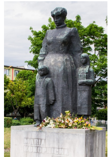
Pomnik Konopnickiej w Kaliszu

Konopnicka zadebiutowała jako pisarka w dzienniku „Kaliszanin”, wierszem dedykowanym miastu Kaliszowi pt. „Zimowy poranek”. Kaliszowi poświęciła jeszcze trzy utwory literackie: „Kaliszowi” z 1888r. i 1907r. oraz „Memu miastu”.